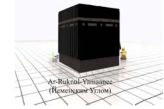
Ar-Ruknul-Yamaane (Иеменским Углом)

رَبَّنَا آتِنَا فِي الدُّنْيَا حَسَنَةً وَفِي الْآخِرَةِ حَسَنَةً وَقِنَا عَذَابَ النَّارِ